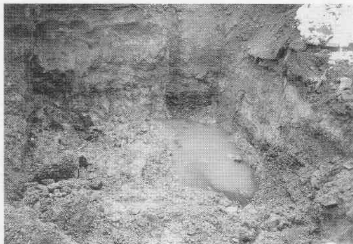
2: Schadensherd mit MKW- und LCKW-Kontaminationen im Bereich der Galvanik

Auf der Grundlage des nachvollziehbaren Fachgutachtens und der Widerspruchsbegründung erfolgte im Mai 1994 in Form