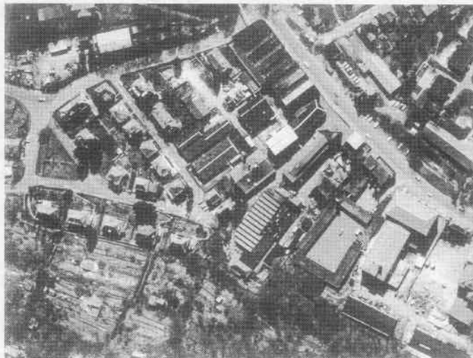
1: Luftbild des Werksgeländes aus dem Jahre 1991

LAKW sowie im Zusammenhang mit Härte- reiprozessen Cyanide und Nitrit zu erwarten.