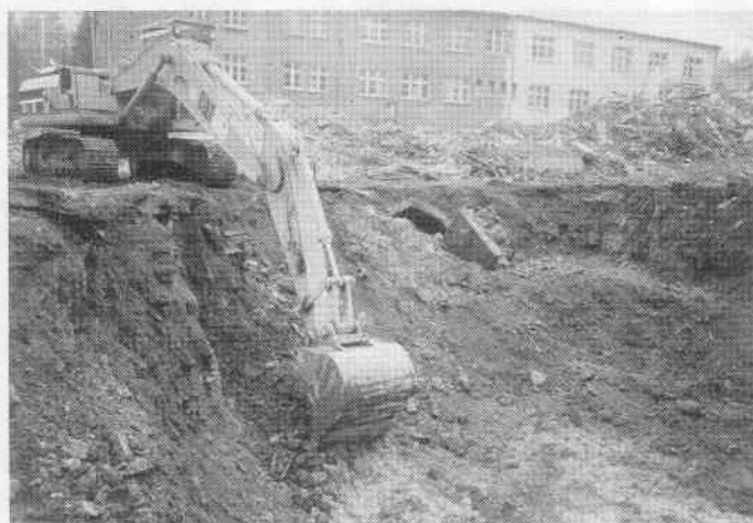
3: Auskoffnung des Hauptschadensherdes „Spänelagerplatz“